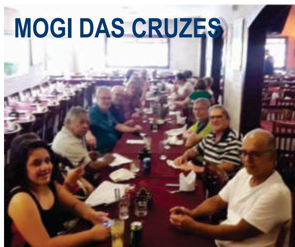
MOGI DAS CRUZES