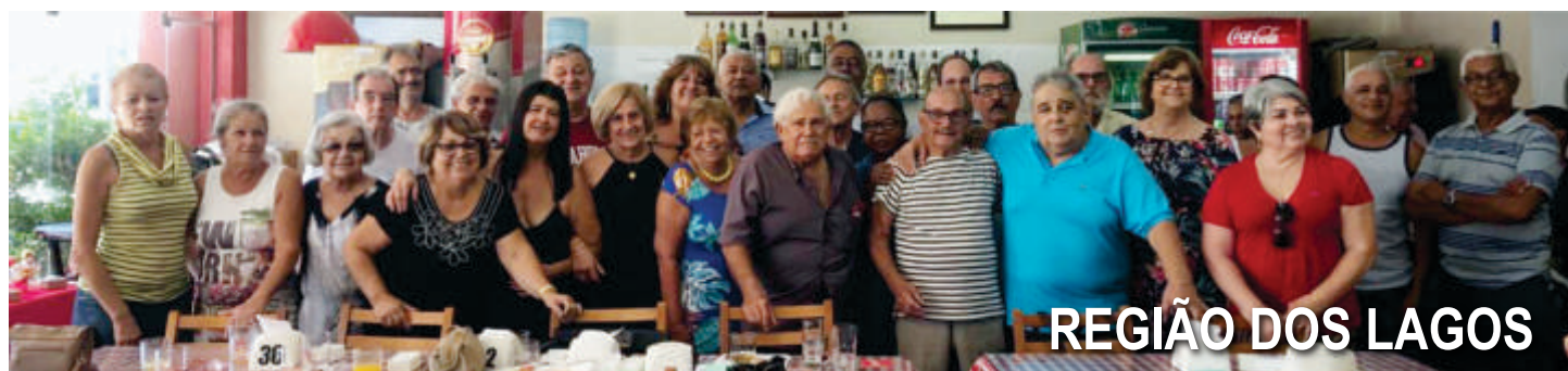
REGIÃO DOS LAGOS