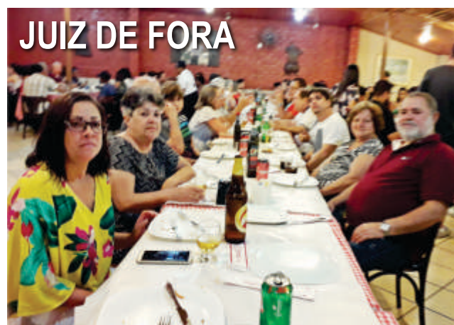
JUIZ DE FORA