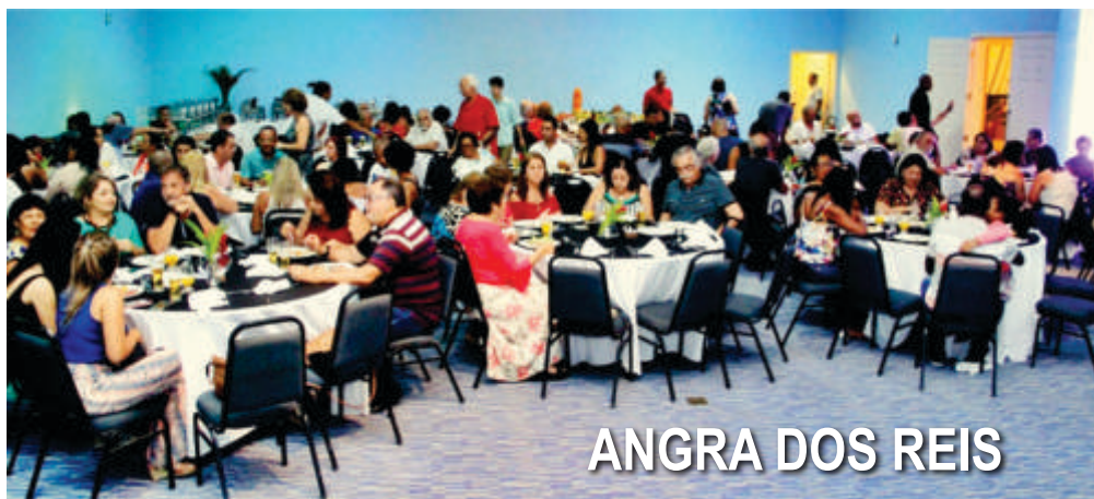
ANGRA DOS REIS

Com esse orçamento, os representantes fazem cotações para realizar o encontro nas suas localidades e informam a APÓS-FURNAS sobre natureza, data e local de cada evento. A Associação envia convites para os associados dessas áreas participarem e, após os eventos, recebe uma prestação de contas desses representantes.