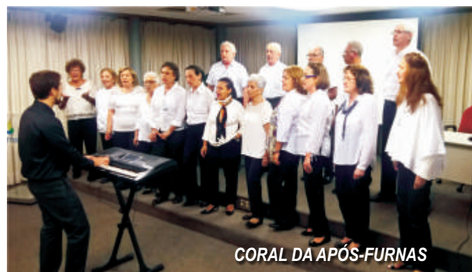
CORAL DA APÓS-FURNAS