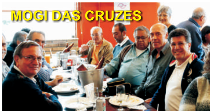
MOGI DAS CRUZES