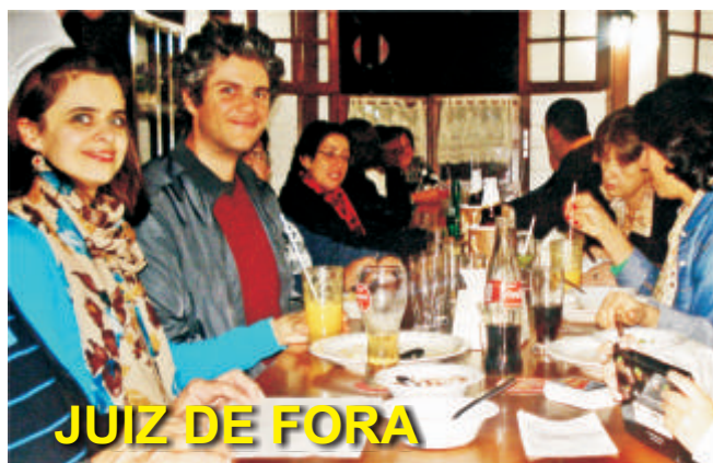
JUIZ DE FORA

As fotos de Campinas infelizmente não tiveram a resolução necessária para uso gráfico. As fotos das demais áreas infelizmente não chegaram a tempo para serem incluídas nesta edição do ELO.