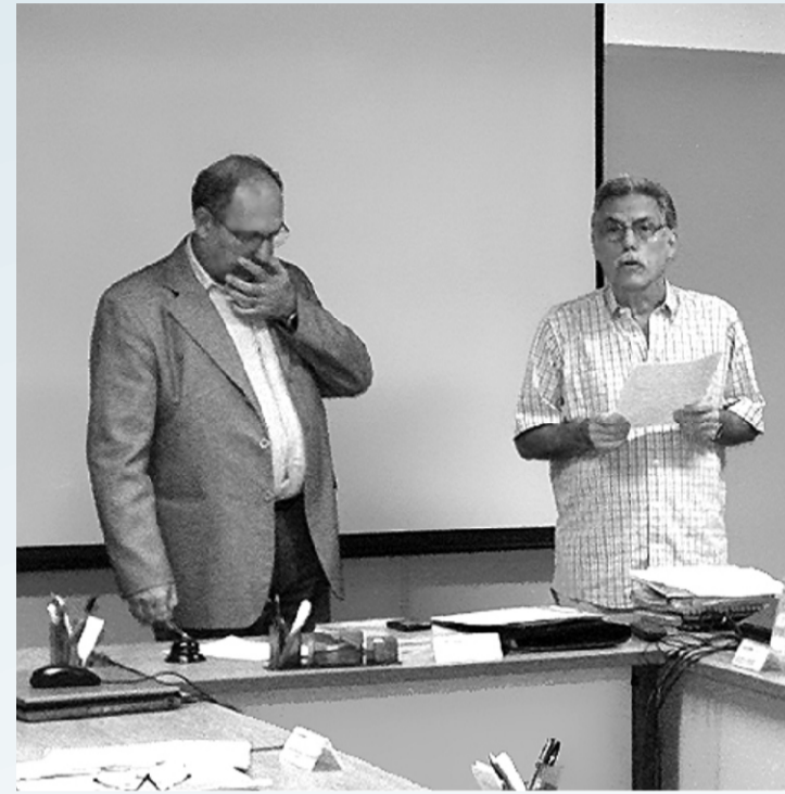
O Diretor-Presidente da APÓS-FURNAS pediu mais

DIRIGENTES DA APÓS-FURNAS , acompanhados de um grupo de pensionistas compareceram à reunião ordinária do Conselho Deliberativo da REAL GRANDEZA, no dia 31 de janeiro, para cobrar dos Conselheiros – pela terceira vez – uma posição quanto ao aumento no percentual pago de pensão pela FRG e a garantia do benefício mínimo.