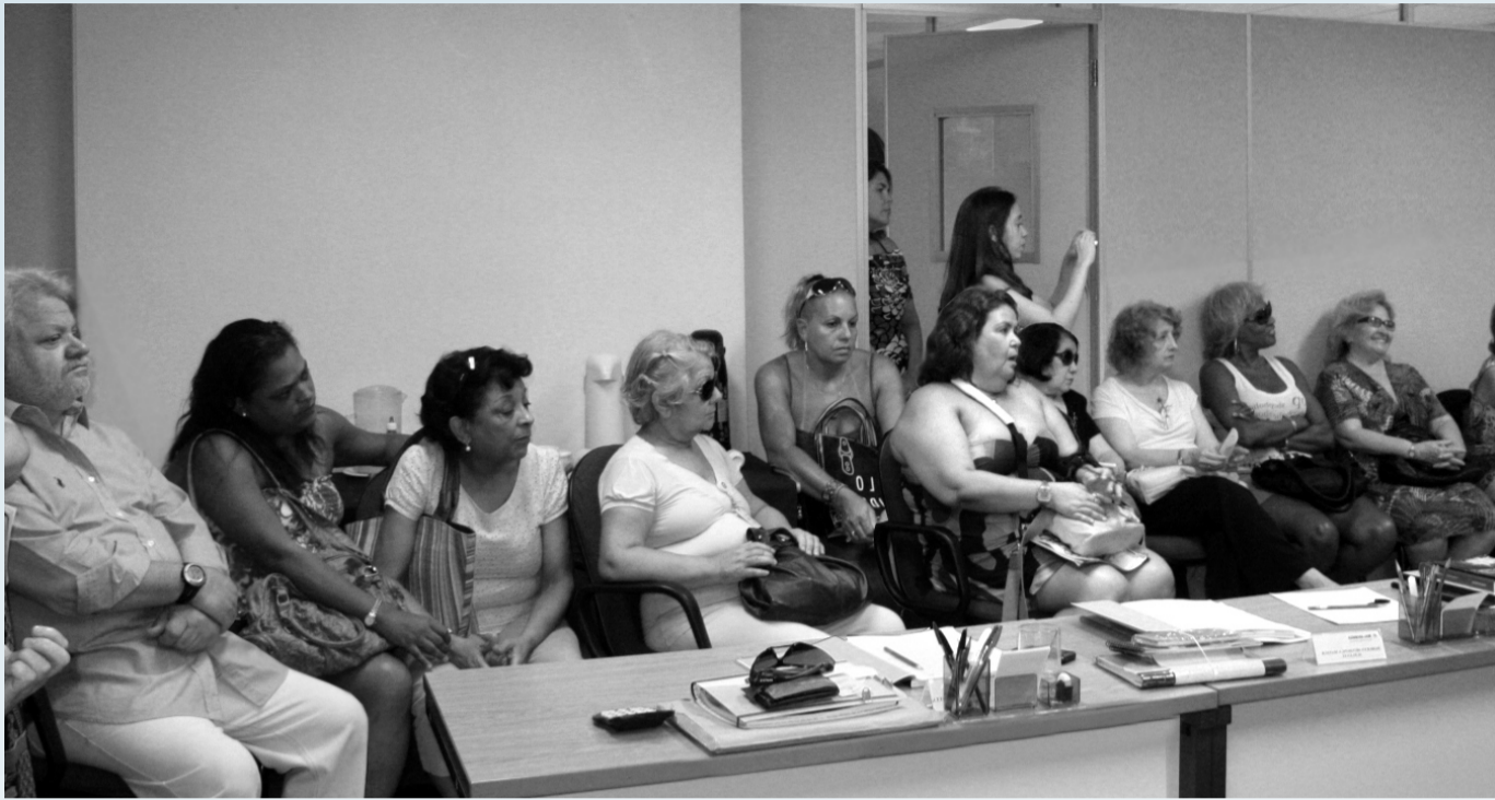
Um grupo de pensionistas escuta os esclarecimentos do Presidente do Conselho da FRG